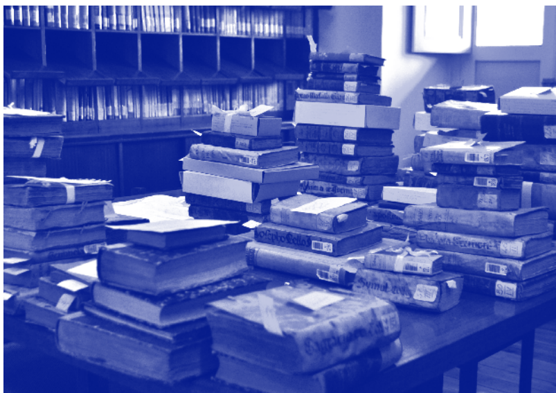
Revisión en sala de ejemplares seleccionados. Septiembre de 2016.

Por último, queremos agradecer a amigos y familiares que han acompañado esta empresa durante más de dos años.